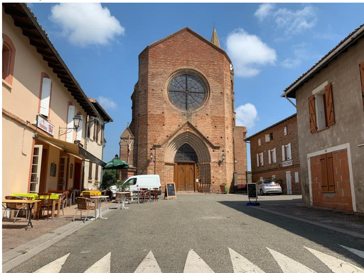
> Centre-bourg de Daux