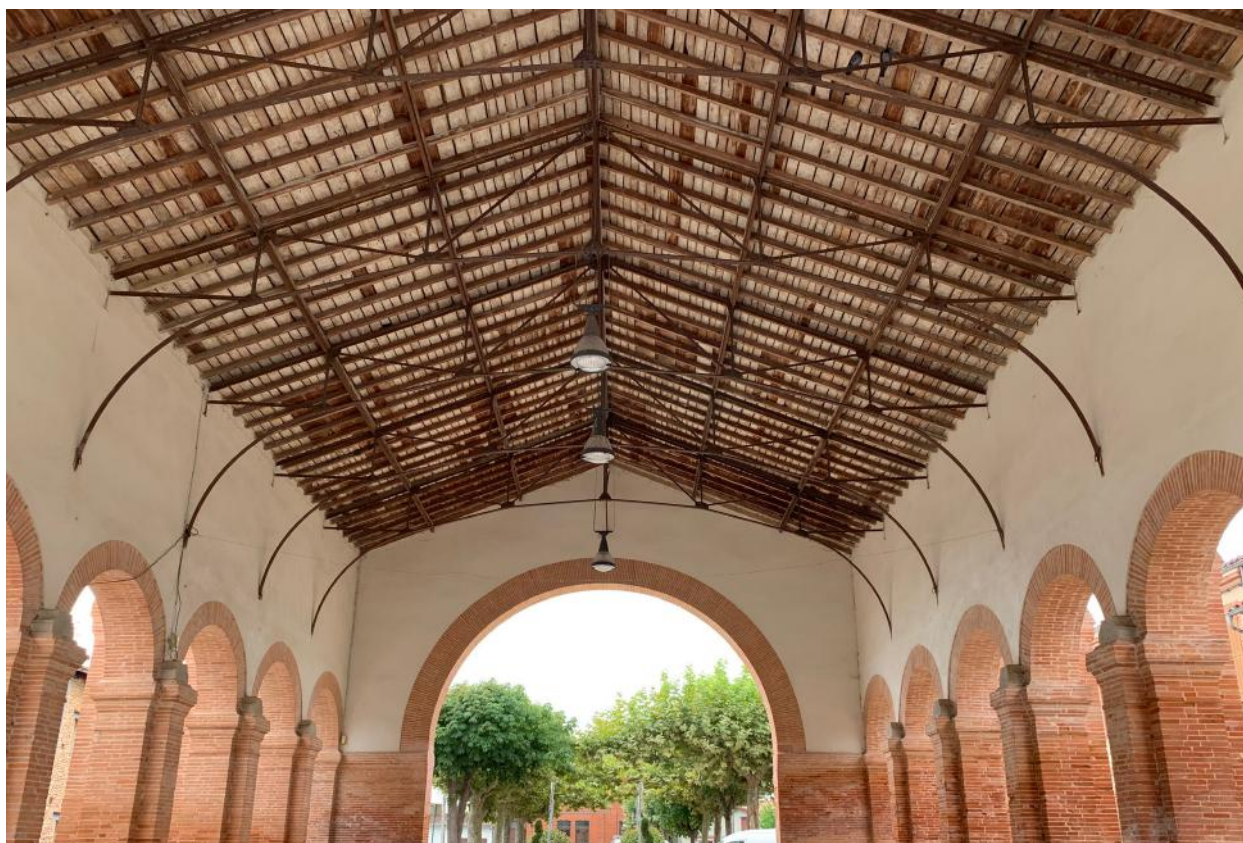
> Halle du centre-bourg de Launac