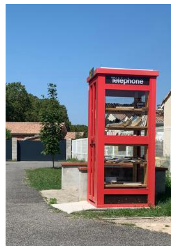
> Boîte à livre de Mirepoix-sur-Tarn