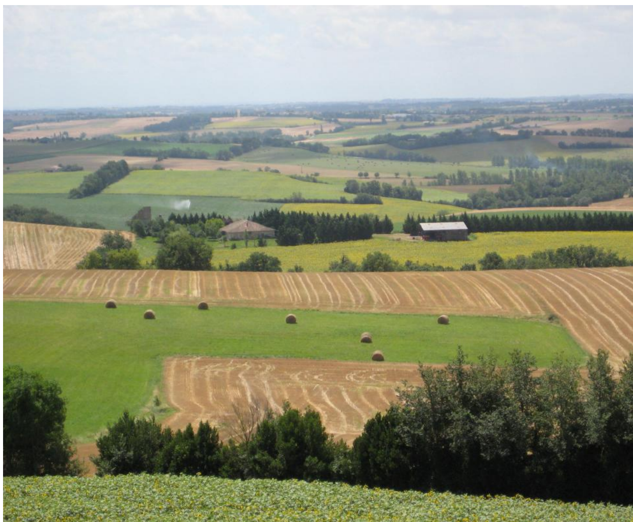
> Paysage agricole, Brignemont

Une cantine centrale, ou une centrale d'achat avec livraison des cantines du territoire, est souhaitée par la majorité des participants. Les élus se sont également accordés sur le fait de promouvoir et d'encourager une agriculture raisonnée, durable, et de tendre à long terme vers l'autonomie alimentaire du territoire.