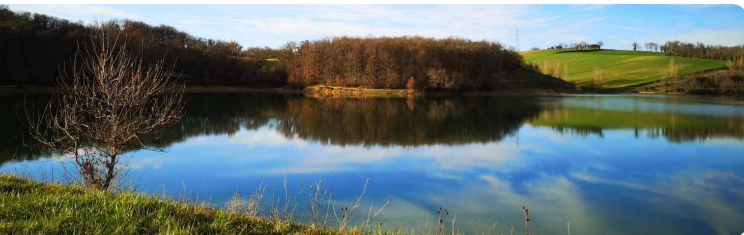
> Lac de la Balerie à Verfeil

AXE 3 : Faire circuler les hommes, les données et les flux [23 octobre 2020]