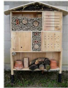
Hôtel à insectes

Pour plus d'informations , consultez la fiche sur les auxiliaires